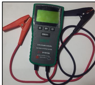
Figura 1: Dispositivo de Medición

También se empleó el método empírico para realizar pruebas de rendimiento del nuevo acumulador, mediante el probador de baterías DY2015a, que se muestra en la figura 1, se verificó la caída de voltaje en los bornes durante el arranque en un ciclo simulado con el vehículo detenido, realizando durante 15 minutos un total de 12 paradas de 30 segundos.